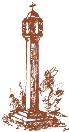
Kapliczka na kurhanie szwedzkim w Jaśliskach

Zachowały się jaśliskie podziemia, budowane jako składy win. Przebiegają pod rynkiem i praktycznie wszystkimi pierzejami. Niektóre z nich mają nawet trzydzieści metrów długości i cztery szerokości. Do takich przestrzeni mógł zjechać wóz z winem, a składować towar można było bardzo długo dzięki stabilnej temperaturze (ok. 10 stopni Celsjusza) w ciągu całego roku. Piwnice nie są niestety dostępne dla publiczności, wejścia do nich znajdują się wyłącznie na prywatnych posesjach.