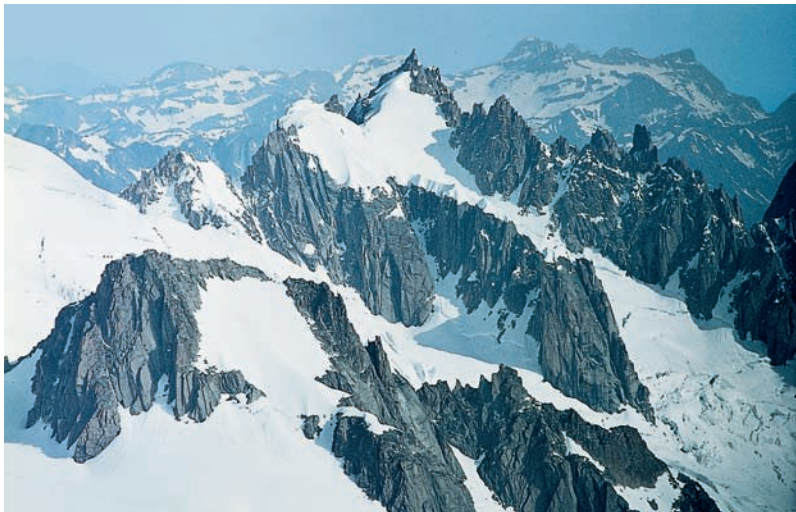
Aiguille du Plan, na lewo grań Aig. du Midi — Aig. du Plan.