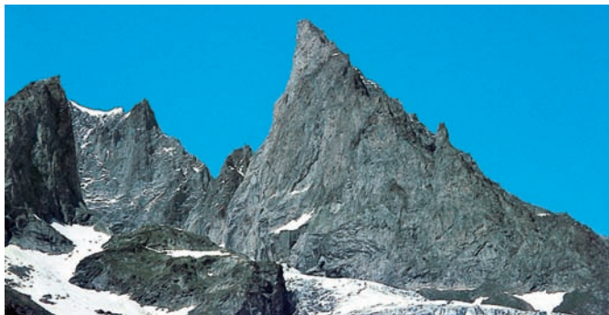
Aiguille Noire wraz ze swoją ścianą zach. i granią pld., na lewo Aiguille Blanche.

de la Brenva od wsch. W tle dominujący, choć częściowo niewidoczny Mont Blanc.