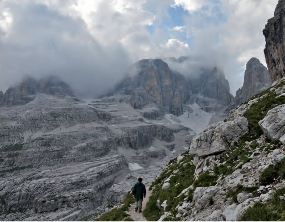
Kocioł pod Cima Tosa

wanie wędrówki po Brennie i są, moim zdaniem, ciekawsze i bardziej urozmaicone niż osławiona ferrata Centrali. Pomimo niezbyt gęstej siatki tras da się tu zaplanować doskonałe wycieczki okrężne, np. z wykorzystaniem Sentiero Palmieri T49, czy ferraty Ettore Castiglioni przez przełęcz Due Denti T54. Trasy poza obszarami wysokogórkimi są rzadko używane i łatwiej tu o samotność.