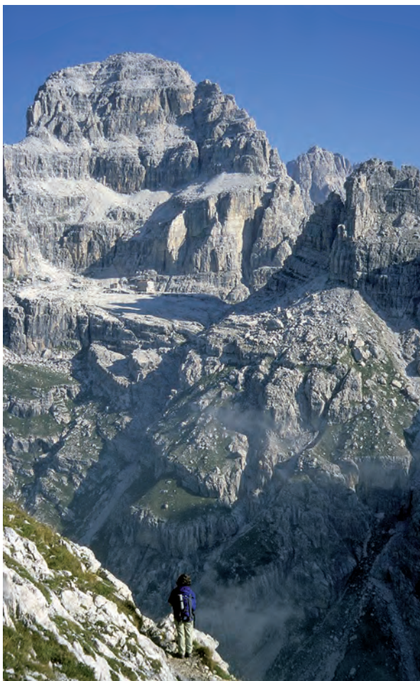
Sentiero Palmieri i okolice schroniska Pedrotti

Opisywany obszar zaczyna się od przełęczy Bocca di Brenta i schroniska Pedrotti T10. Szczyt Cima Tosa wysyła dokładnie na południe dwa wielkie ramiona, które obejmują dolinę Val Ambiez i kończą się nad komunikacyjną doliną Val Giudicarie. Przewyższenie grani w stosunku do doliny wynosi