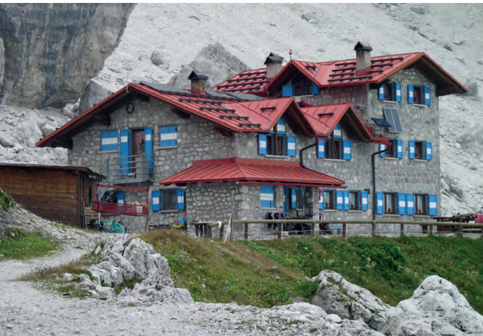
Schronisko Silvio Agostini

Schronisko kluczowe dla turystyki w południowej Brentie. Stoi w miejscu, gdzie wielka dolina Ambiez, podchodząc pod grań rozchodzi się na kilka wysokogórskich kotłów. Jeden z nich wciska się wąskim gardłem pod masyw najwyższego szczytu Cima Tosa (3173 m). Tworzy przy tym najbardziej spektakularny krajobraz skalno-lodowy Brenty. Ale nie tylko krajobraz jest mocną stroną schroniska. Jest to również miejsce, gdzie wielu górolazów kończy (lub zaczyna) wędrówkę słynną Via delle Bocchette. Co prawda można iść dalej do schroniska XII Apostoli przez Sentiero Ideale (patrz T53), ale wymaga to co najmniej jednego dnia więcej i może być trudne, ze względu na warunki na lodowcu Camosci. Tymczasem z Agostini powrót do części centralnej jest szybki i ciekawy przez Sentiero Palmieri T49. Ze względu na nieco skrajne położenie jest nie tak tłoczno, jak w przeludnionym zwykle Pedrotti. Wychodząc ze schroniska Agostini, mamy do dyspozycji, oprócz trudnych przejść lodowych również ciekawą ferratę Castiglioni T54 przez przełęcz Due Denti do schroniska XII Apostoli. Znajdujący