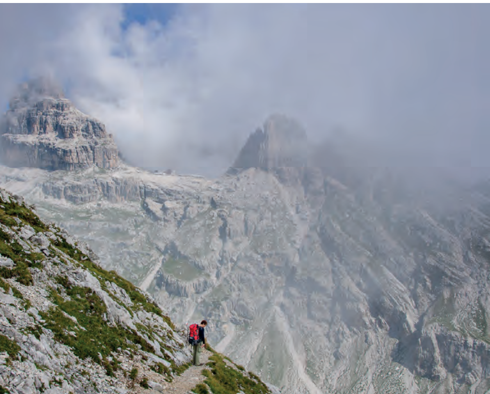
Wspaniałe górskie krajobrazy na trasie Sentiero Palmieri – w oddali nasz cel – schronisko Pedrotti