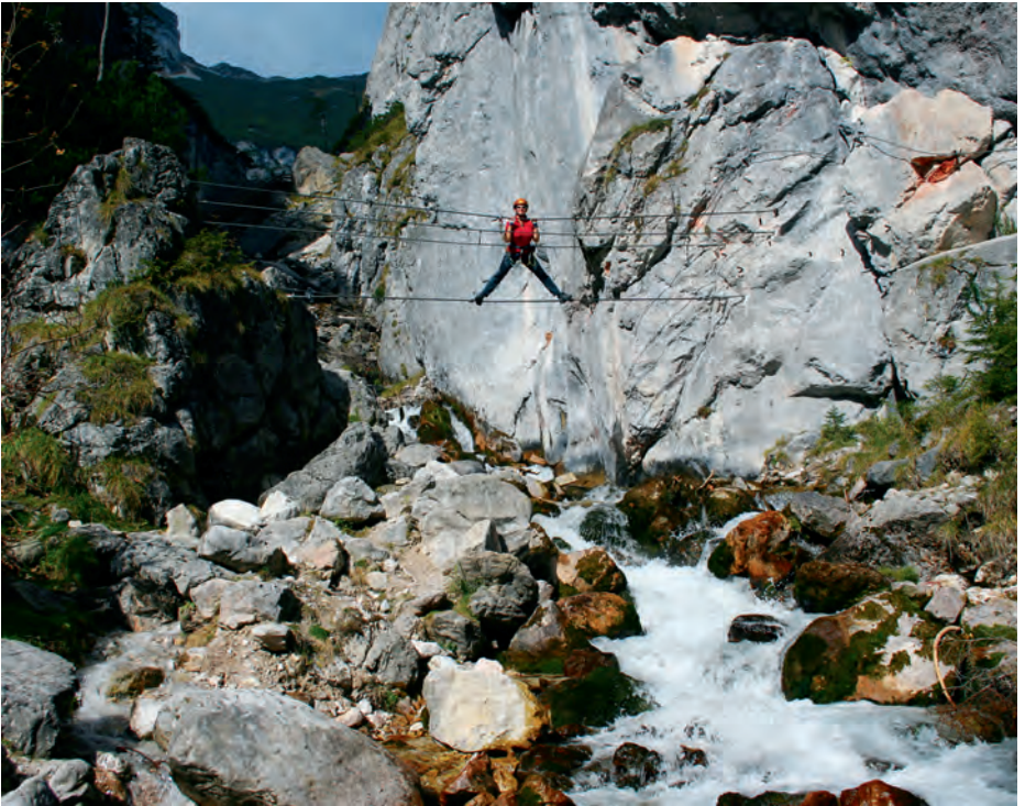
Most linowy na początku ferraty Hias-Klettersteig

trawersem do zakrętu trasy na skalnej krawędzi, po czym wspinamy się dłuższą, gładką ścianą na tarcie (C). Docieramy do krawędzi skały i podchodzimy do drugiego, nieco dłuższego, ale równie łatwego mostu linowego (B). Dalej czeka nas ziemisty fragment prowadzący stromym, porośniętym drzewami grzbietem. Za nim wspinamy się na stromą ściankę z białym wyłomem (miejsce kluczowe, narastająca ekspozycja, wyczerpująca końcówka, C–D). Łatwo trawersujemy do następnej stromej krawędzi. Wygląda ona na trudniejszą, niż jest w istocie (na dole C–D, później C). Za ścianką trawersujemy w prawo przez las do następnej ścianki (C). Za nią podchodzimy przez las, idziemy w prawo do małej niszy, w ekspozycji wspinamy się do zalesionego grzbietu i wkrótce docieramy do końca ferraty obok słupa kolejki zaopatrzeniowej (ok. 1200 m). Czas przejścia: \frac{3}{4} godz.