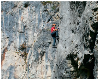
Stroma wspinaczka po prętach

Lata powstania: Hias 2006, Siega 2008, Rosina 2014