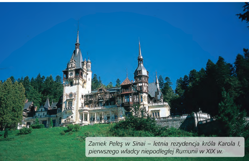
Zamek Peleş w Sinaia – letnia rezydencja króla Karola I, pierwszego władcy niepodległej Rumunii w XIX w.

wysiąć z bezpośredniego pociągu z Bukaresztu i iść prosto w góry, albo nawet (w Sinaia i Bușteni) wjechać na nie kolejką. O ile wierzchołki wschodniej grani zostały zniszczone wskutek rozwoju infrastruktury, o tyle podejście z doliny Prahovy – wśród kwiatów i, z dużym prawdopodobieństwem, w towarzystwie kozic (lub nawet niedźwiedzia) – będzie prawdziwą przyjemnością. Miasta same w sobie mają wyjątkowy charakter. Sinaia jest pełna starych willi i oferuje najbardziej luksusowe hotele – to największy kurort w dolinie i przy tym... najdroższy. Bușteni za to wyróżnia spektakularne położenie u podnóży najbardziej skalistej i robiącej największe wrażenie części wschodniego ramienia masywu Bucegi. Podobnie jak w Sinaia, tu też znajdziemy kolejkę linową, z tym że tutejsza jest bardziej widowiskowa: żegluje w powietrzu ponad wąwozem rzeki Jepilor na plateau Bucegi, tuż pod same Babele*. Najwyżej położony jest Predeal – punkt wypadowy wędrowek w góry Piatra Mare i Postăvaru, jak również w pn. Bucegi.