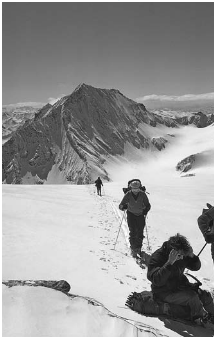
Na przeł. Col de Chasseforêt.

Ze schroniska zjeżdżamy w kierunku wschodniego brzegu j. Lac Long, by następnie rozpocząć strome podejście na pn.-wsch., w kierunku zachodniego jezora lod. Glacier des Grands Couloirs (S3). Podejście lodowcem jest strome, a sam lodowiec w znacznym stopniu pokryty szczelinami — czeka nas odcinek wspinaczki. Stopniowo, zbocze staje się łatwiejsze, ale nadal jest dość strome i nie brakuje w nim szczelin. Kontynuujemy wspinaczkę w kierunku wsch. do wysokości ok. 3350 m. W tym miejscu przekraczamy olbrzymią szczelinę brzeżną (możliwość zostawienia nart). Zbocze nad nami ponownie staje się bardzo strome (S4/S5), aż do wysokości ok. 3600 m, gdzie lodowiec się wypłaszcza. Znajdujemy się pod przeł. Col des Grands Couloirs. Nie wchodzimy na nią, lecz wspinamy się bezpośrednio (kierunek pn.-wsch.), stromą pd. ścianą La Grande Casse, do punktu na zachodniej