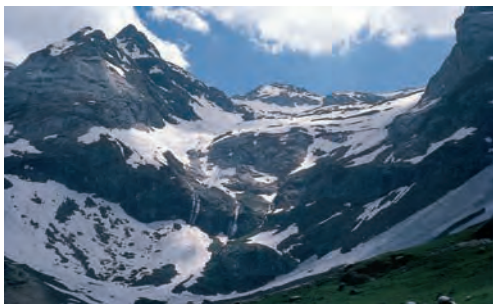
Pic de Gabiétou i Cyrk Troumouse

Wracamy tą samą ścieżką (2 godz.) albo idziemy szlakiem do parkingu przy końcu drogi i następnie wędrujemy nią w dół (istnieją skróty), obok pensjonatu Auberge de Maillet, z powrotem do Héas (1½ – 2 godz.).