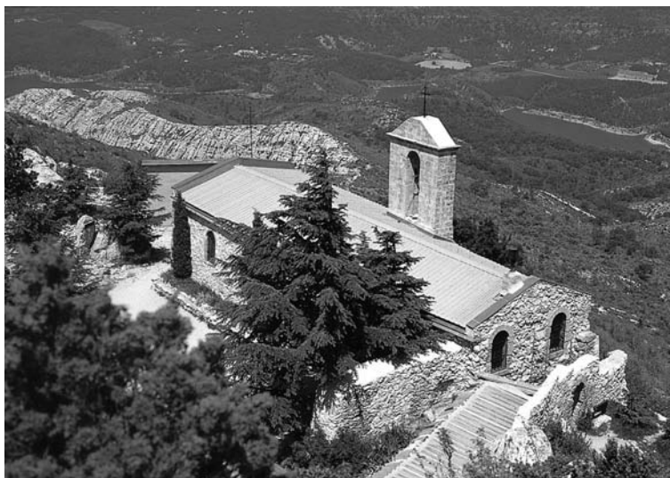
Kościół Notre Dame Ste-Victoire